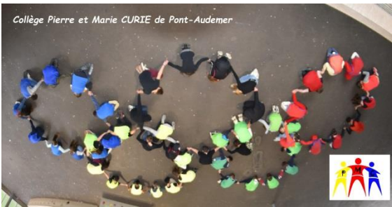
Collège Pierre et Marie CURIE de Pont-Audemer