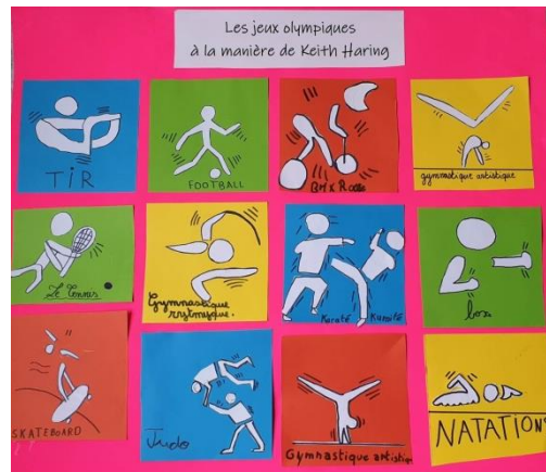
Les jeux olympiques à la manière de Keith Haring