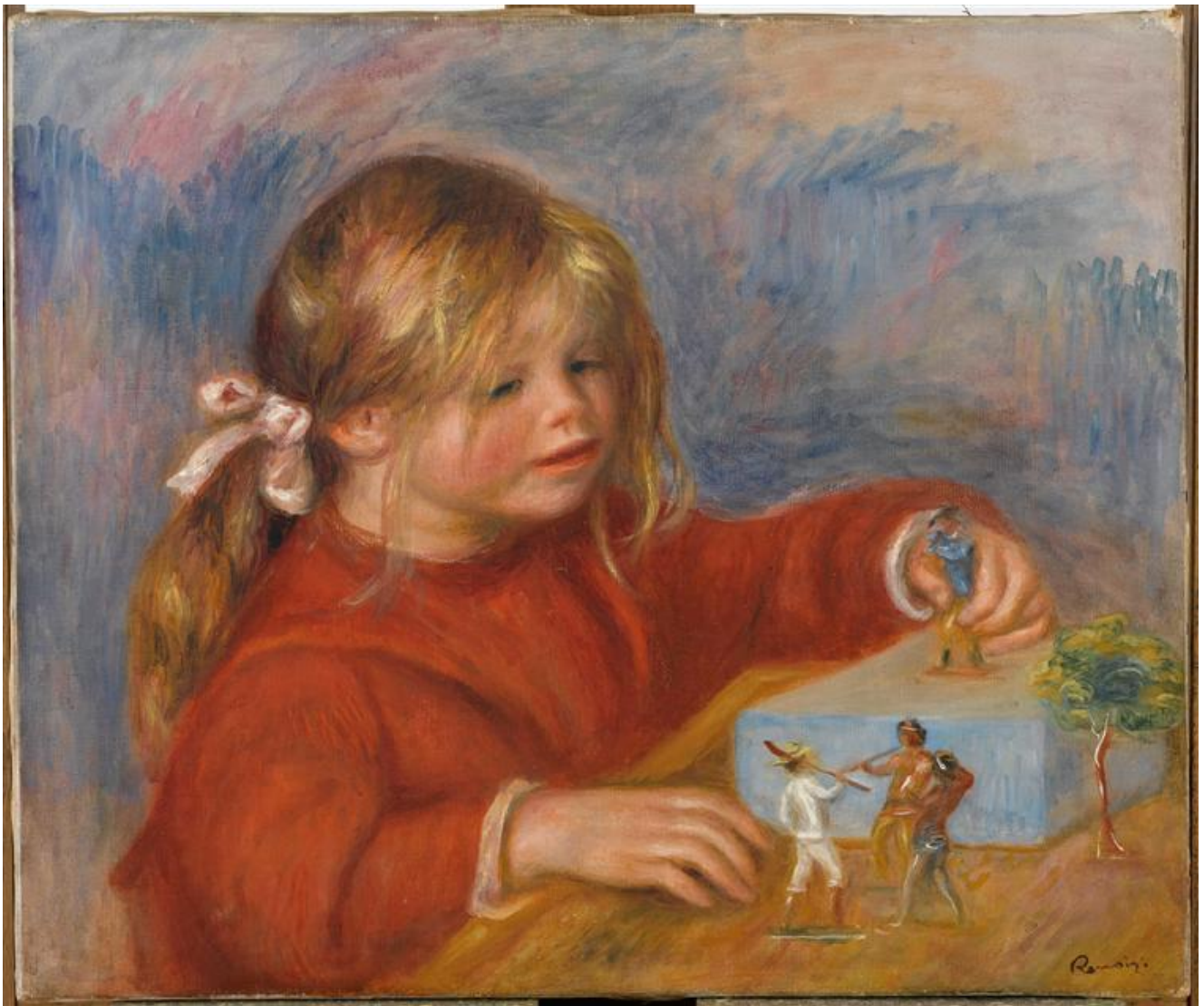
Auguste Renoir : Claude Renoir, jouant , vers 1905, huile sur toile, Musée de l'Orangerie, Paris.