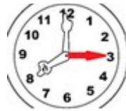
Flèche amovible sur une horloge