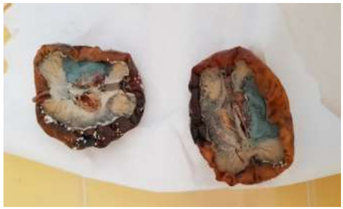
Différents états d'avancement du pourrissement de la pomme.