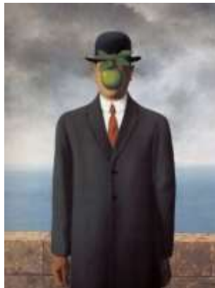
Le fils de l'homme- Magritte