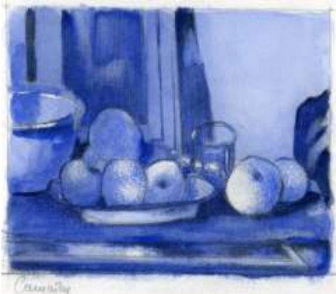
Camaïeu- Claude Briceau