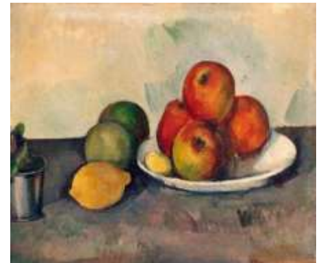
Nature Morte – Cézanne