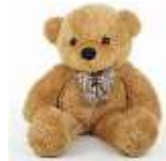
Vidéo « where is my Teddy Bear ? »