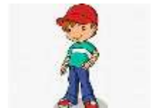
Vidéo « where is my cap ? »