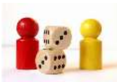
Les prépositions spatiales