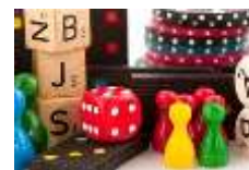
Fixation du vocabulaire de la chambre