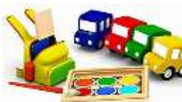
Fixation du vocabulaire de la maison