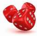
Fixation du vocabulaire de la chambre