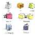
Vidéo de présentation « les prépositions de lieux »