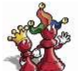
Les prépositions spatiales « where is Spot ? »