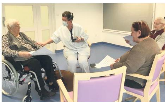
→ À l'Ehpad de la Quincampoise, lors d'une séance d'enregistrement de poèmes à l'intention des enfants.