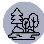
Description de paysages