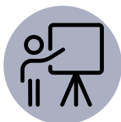
Le documentaire/ l'exposé