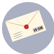
la carte postale