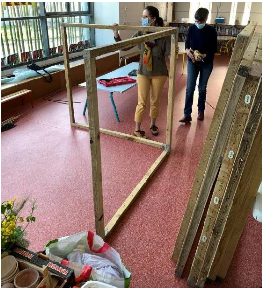
Construction de la structure