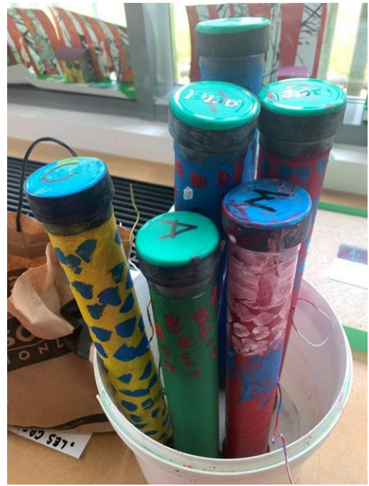
Peinture des bâtons de pluie