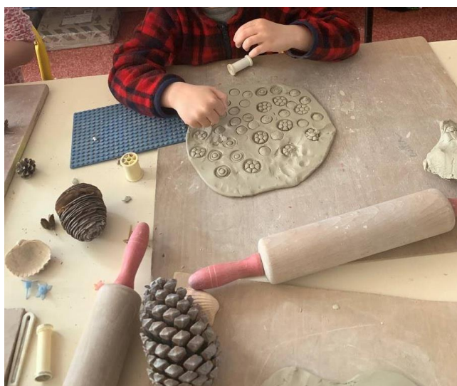
Réalisation de mosaïques Empreintes sur plaques d'argile et mise en forme