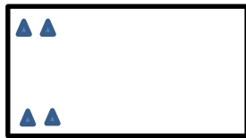
Aller-retour entre deux plots = 50 m

Selon la configuration de l'école, il faut jalonner un parcours simple de 50 à 200 m environ. Il peut faire le tour ou une partie de la cour de récréation. Le parcours doit être matérialisé à l'aide de marquage au sol (peinture ou craie) ou éventuellement avec des plots (mais ces derniers ne resteront jamais en place!)