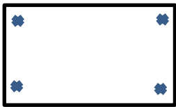
Tour de la cour = 150 m