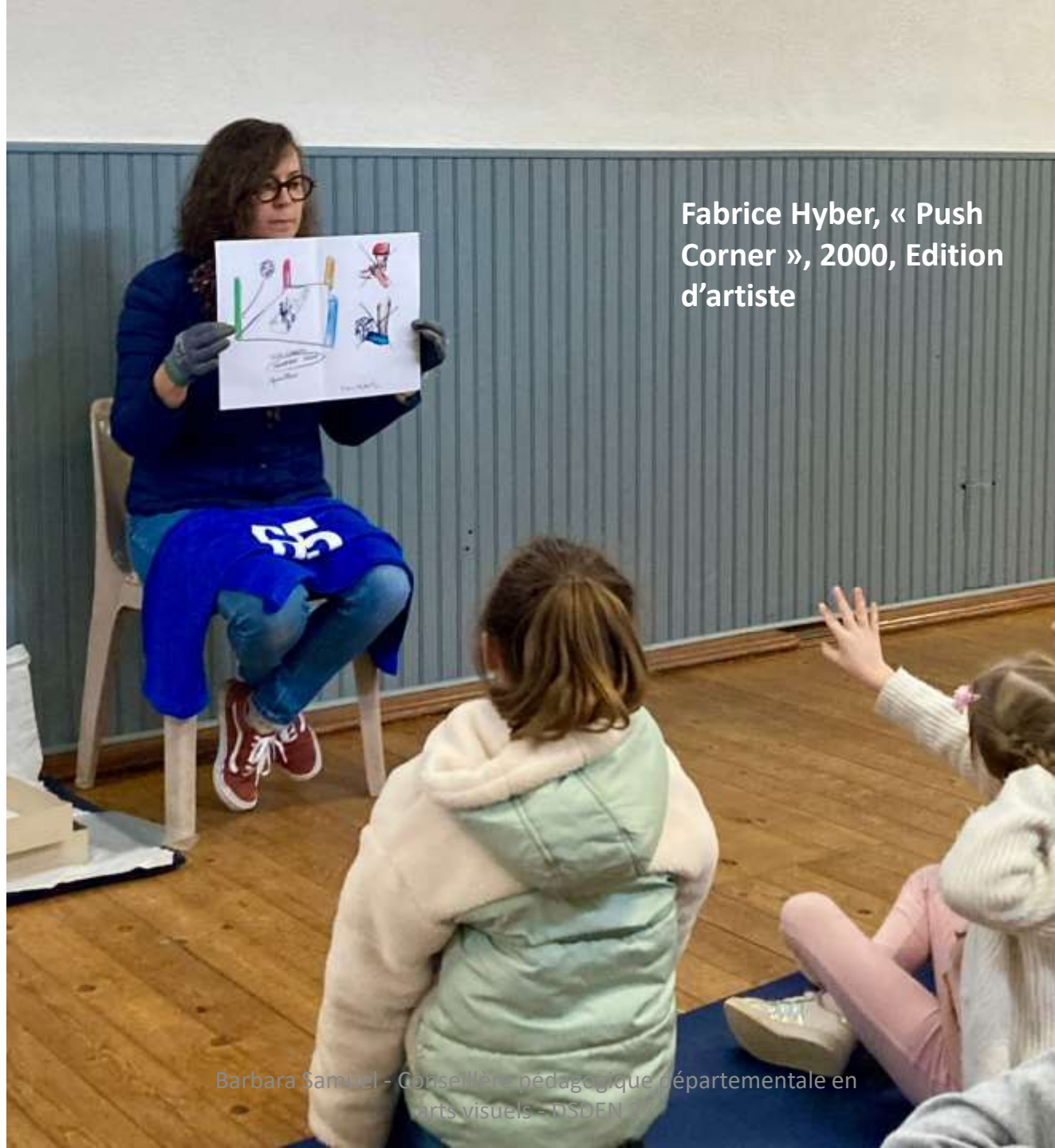
Fabrice Hyber, « Push Corner », 2000, Edition d'artiste