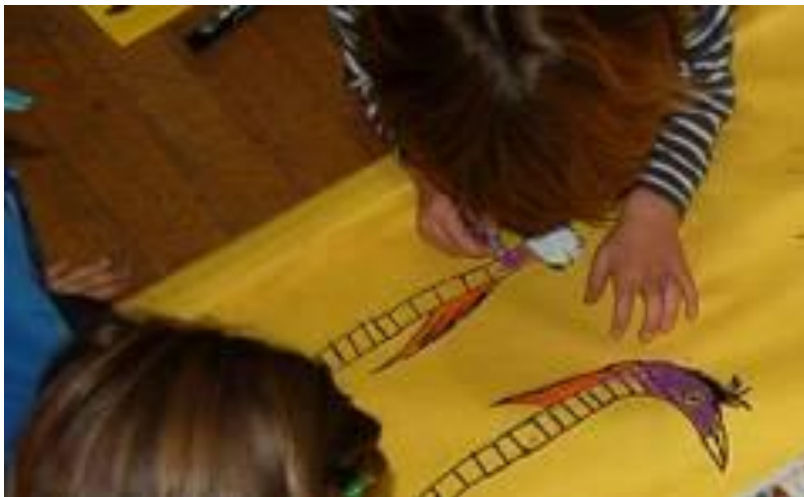
La lettre U...

Dessine sur la lettre, autour de la lettre pour la transformer en cet animal.