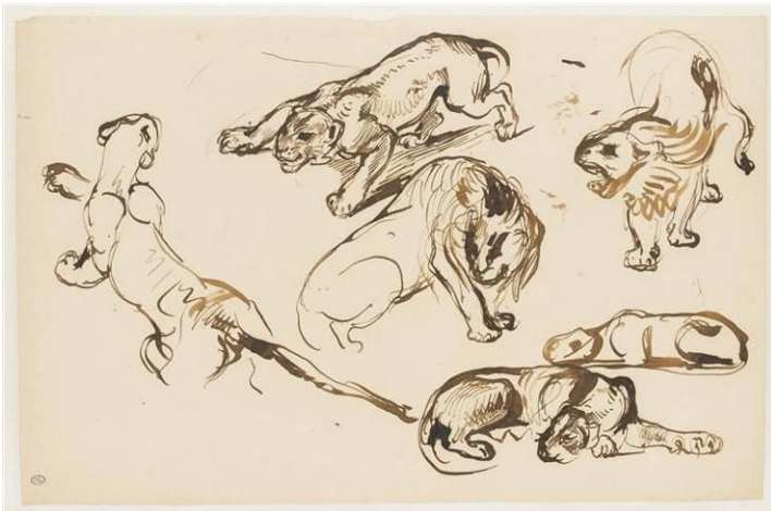
Eugène Delacroix (1798-1863), Etudes de fauves dans diverses attitudes, dessin à la plume

Ecris le nom de ton animal et la date puis signe.